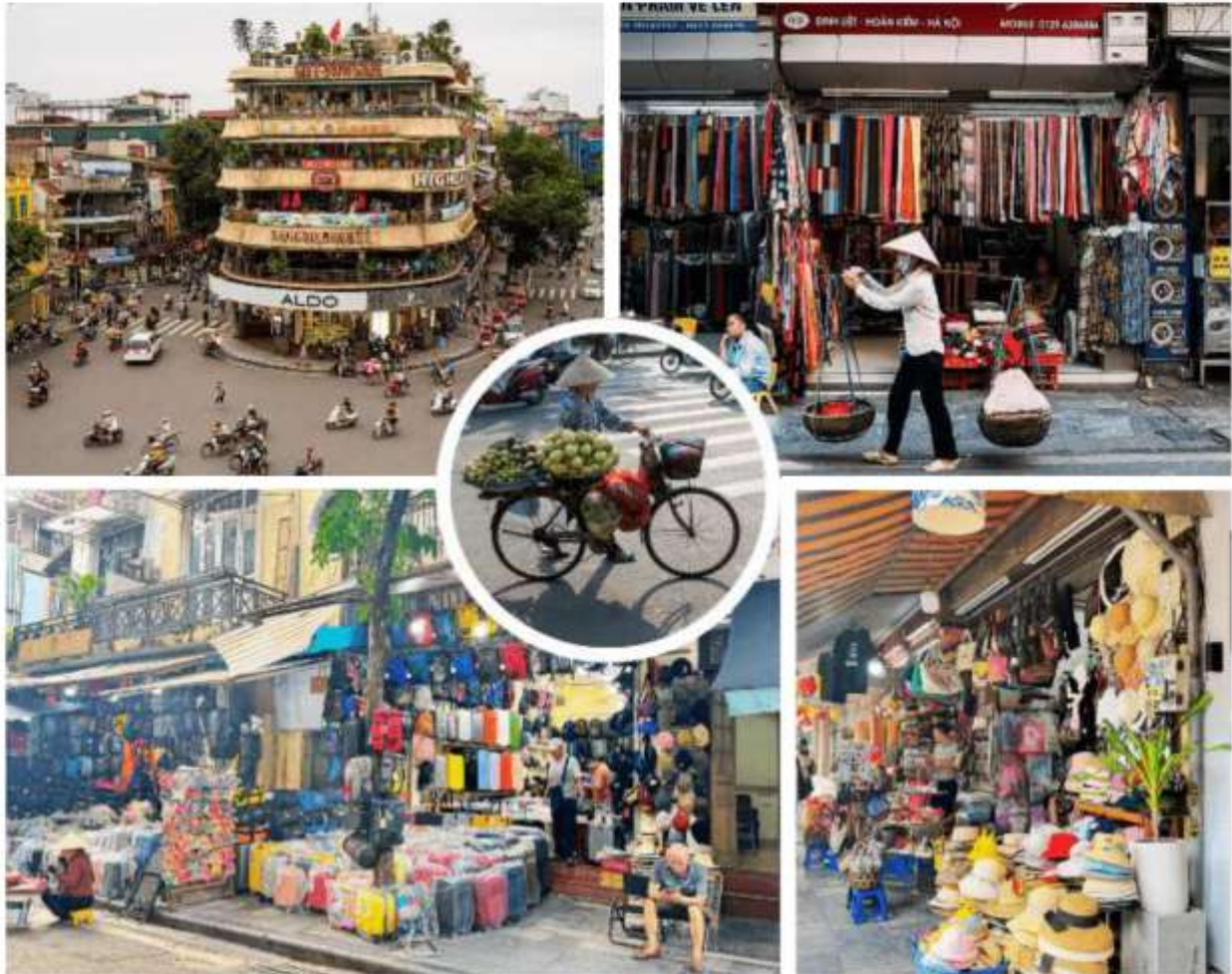
รูปภาพใช้สำหรับการโฆษณาเท่านั้น

จับจ่ายใช้สอยสินค้าบนานาชนิด โดยถนนแต่ละสายก็จะขายของที่แตกต่างกันออกไป อย่างเช่นขายรองเท้าถนนสายนั้นก็จะขายรองเท้าตลอดสาย ขายของที่ระลึกก็ขายของที่ระลึกตลอดสาย เป็นต้นแต่ปัจจุบันถนนแต่ละสายจะขายสินค้าแตกต่างกันไปมีทั้งของกิน เสื้อผ้า และของที่ระลึกที่เป็นทั้งผ้าไหม กระเป๋า หรือเครื่องเงินที่มีลวดลายปราณีตสวยงามมากมาย